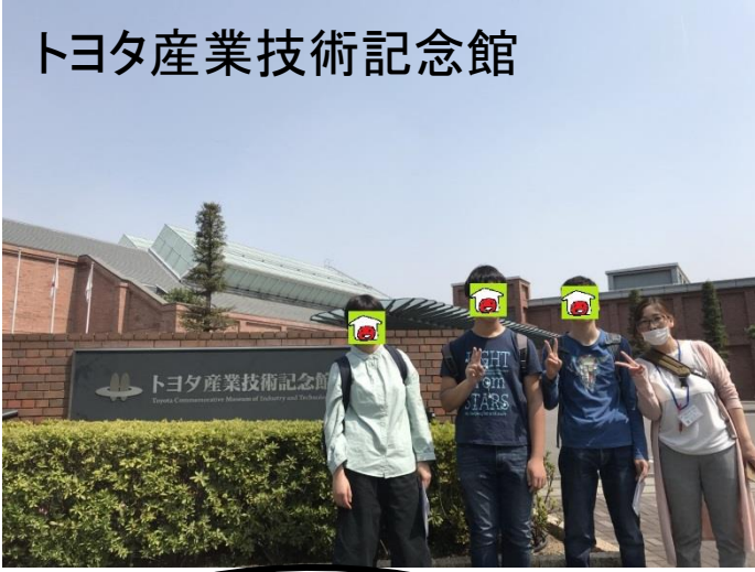
トヨタ産業技術記念館